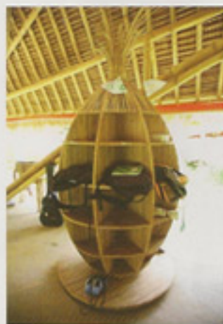
教室のロッカーもバンブー製。生徒たちは温かく、アーティスティックなものに囲まれている

ふとジョン・ハーディー氏は「日本の教育現場はどうなっていますか」とまっすぐな目を向けてきた。思わず口ごもる私たちに、「日本は竹の文化がもともとありますよね」と話かけのような言葉を発した。丈夫で成長が早く、循環する。まさにジョン・ハーディー氏の教育哲学の象徴であるバンブー。かつて生活の中に竹が息づいていた日本での開校を、近い将来考えているのかもしれない。