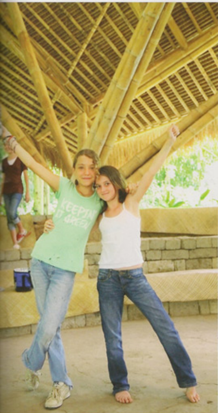
昼食後、食堂で羽を伸ばす生徒たち。食事はスクール内の菜園でとれた野菜などで毎日つくられている。この日のメニューは餅米のバナナ葉蒸しと青菜と豆を炒めたもの、デザートには新鮮なパイナップルが出された