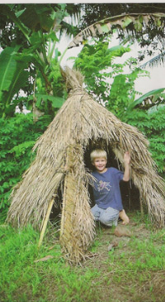
グリーン・スクールのキンダーガーデン。天然素材のユニークな遊具がそろう