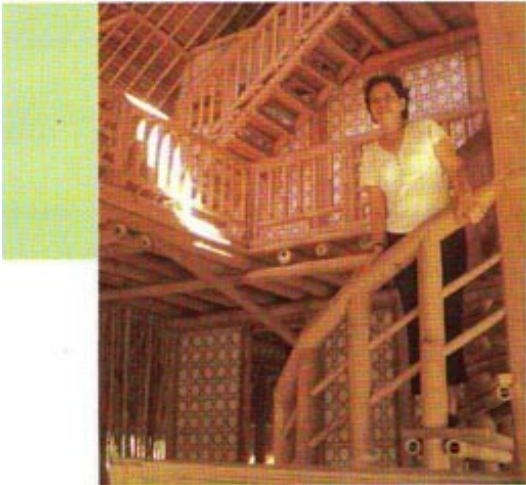
(Kiri atas) Belajar biologi tumbuhan bukan di kelas, tapi di lapangan. (Kanan atas) Terowongan yang dibangun untuk membuat AC alam. (Kiri bawah) Penulis di bangunan untuk praktik memasak, pekerjaan tangan, menukang dan lainnya.